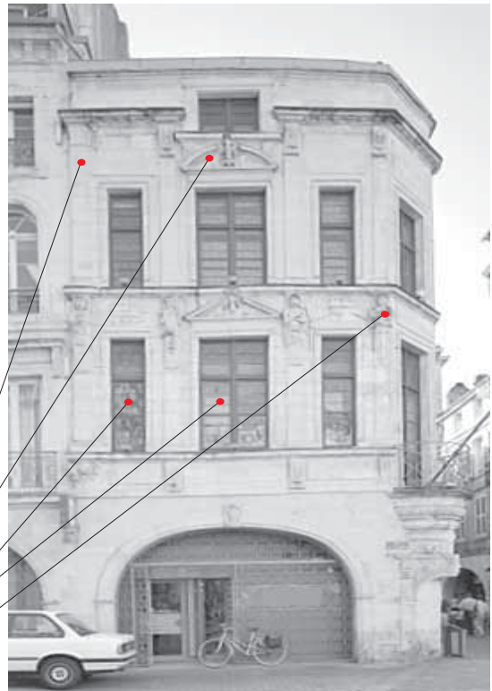
17 La Rochelle

pignon découvert : toit en retrait de la façade